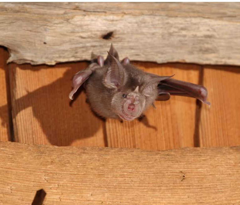
Abb. 2: Grosse Hufeisennase, Jungtier.

Die Grosse Hufeisennase ist eine dachstockbewohnende Fledermausart. Nur warme und störungsfreie Quartiere sind für die Jungenaufzucht geeignet. Erst Ende Juni, anfangs Juli werden darin die Jungtiere geboren. Die Weibchen der Grossen Hufeisennase bringen wie die meisten einheimischen Fledermausarten nur ein Jungtier (Abb. 2) zur Welt und dies nicht jedes Jahr.