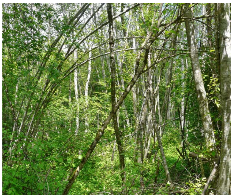
Abb. 3: Jagdgebiet der Grossen Hufeisennasen in den Vorderrheinauen bei Castrisch.

niken. Sie jagt zwischen den Bäumen von lichten Wäldern oder von Obstgärten in ununterbrochenem Flug. An Wald- und Heckenrändern hingegen kann sie bei der für diese Fledermausart besonders charakteristischen «Wartenjagd» beobachtet werden. Die Grosse Hufeisennase hängt dabei an einem Baum oder Strauch am Waldrand oder im lichten Laubwald, ein bis zwei Meter über dem Boden. Den Körper unablässig um die eigene Körperachse drehend, ortet sie in der Nähe vorbei schwirrende Insekten. Hat sie ein Beutetier entdeckt, fliegt sie meist nur wenige Sekunden von ihrer Warte weg, versucht das Insekt zu erhaschen und kehrt danach wieder zur Warte zurück. Dort frisst sie das erbeutete Insekt, nachdem sie es mit Hilfe ihrer kleinen, spitzen Zähne von den unverdaubaren Flügeln und Beinen befreit hat, oder sie wartet auf ein nächstes Beutetier. Typisch für die Wartenjagd ist, dass die kurzen Flugphasen nur einen kleinen Teil der gesamten Jagdzeit ausmachen und die Tiere mehrheitlich hängen. Möglicherweise wendet die Grosse Hufeisennase diese Energie sparende Jagdtechnik vor allem bei geringer Fluginsektenichte oder bei Vorkommen von besonders «ergiebigen» grossen Beutetieren an. Kotanalysen haben gezeigt, dass Käfer, Falter, Hautflügler und Zweiflügler die Nahrungsgrundlage der Grossen Hufeisennase bilden, wobei vor allem mittlere und grosse Insekten gefressen werden. Grosse Hufeisennasen können daher als Nahrungsspezialisten bezeichnet werden.