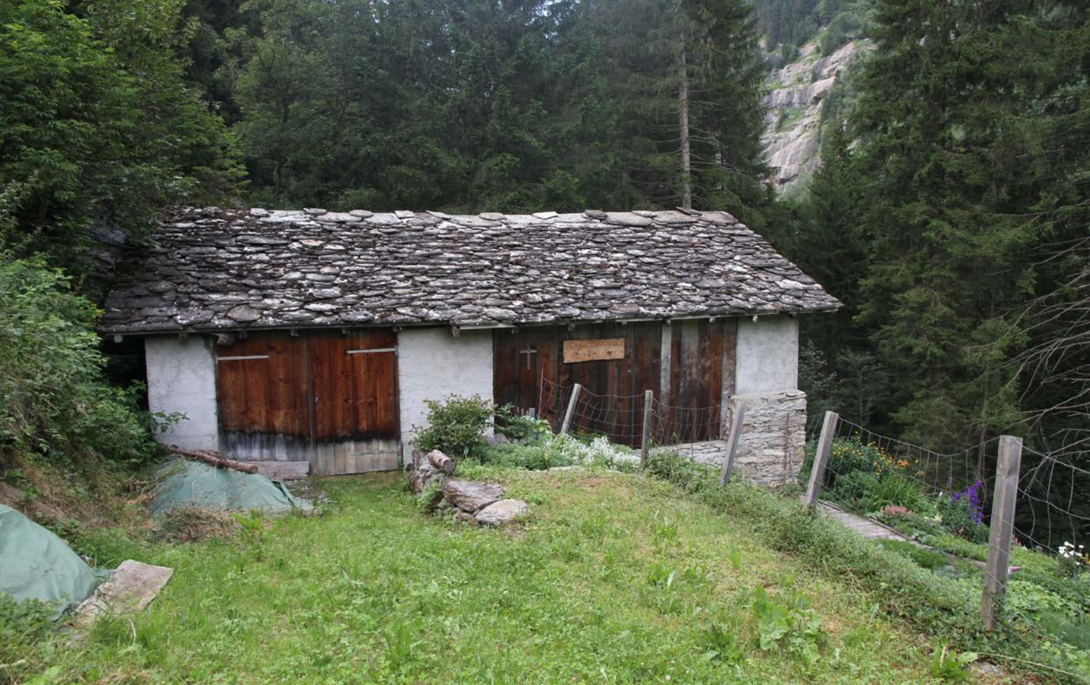
Abb. 7: Traditioneller Stall in Vals (1230m über Meer) mit Wochenstubenquartier der Kleinen Hufeisennase.